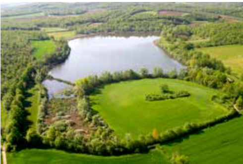
Etang de Lemps, D. Jungers

De mai à octobre 2020, des guides nature seront présents sur les ENS pour vous les faire découvrir.