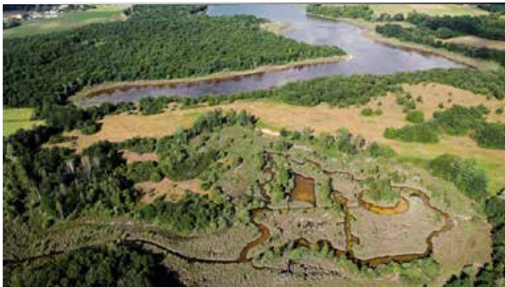
Etangs de Mépieu, D. Jungers

Dans ce cadre, l'association Lo Parvi organise chaque année des chantiers nature ainsi que des visites guidées pour faire découvrir la réserve et ses richesses au plus grand nombre.